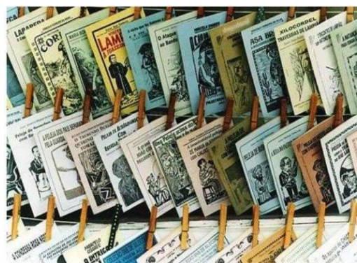
Venda de Literatura de Cordel no Rio de Janeiro, 2010

Caro (a) aluno (a), esperamos que você esteja bem! Nestas atividades continuaremos o estudo dos poemas. Agora veremos a poesia de Cordel, sua origem, linguagem e características. Leia o texto com atenção e conheça um gênero textual, que de forma genuína, retrata a nossa cultura.